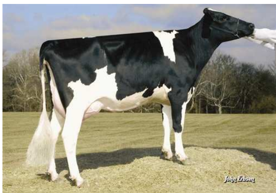
PINE-TREE MARTHA SHEEN TY FIFTH DAM