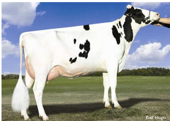
AMMON-PEACHEY SHANA FOURTH DAM